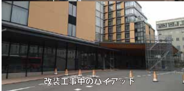
改装工事中のハイアット