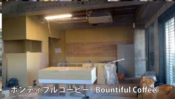
ボンティフルコーヒー (Bountiful Coffee)