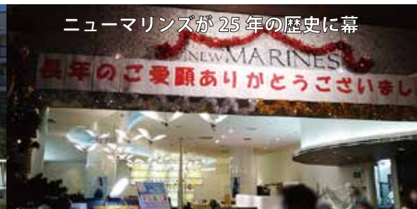
ニューマリンスが25年の歴史に幕