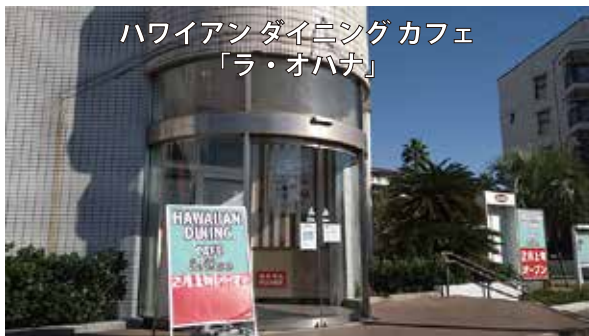
ハワイアンダイニングカフェ 「ラ・オハナ」

新浦安ナビでは皆様からの情報提供をお待ちしております。 FAX: 047-380-9273 メール: webmaster@shinurayasu-navi.com